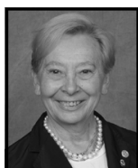
1° anno Francia