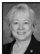
2° anno Oregon U.S.A.