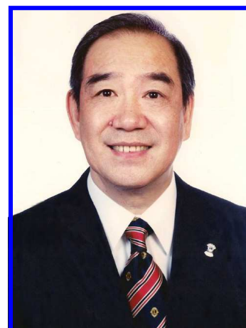
Wing-Kun Tam Presidente Internazionale

I rapporti preliminari indicano che tutto sta nel fornire servizi di cui la comunità ha bisogno. Credo che quello che impariamo oggi guiderà i club verso un service sempre più rilevante a favore della loro comunità. Sono curioso di sentire le loro scoperte e i loro suggerimenti che condividerò con voi, per farne una risorsa preziosa per le nostre comunità. Un cordiale saluto