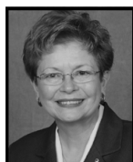
1° anno Connecticut U.S.A.