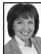
2° anno Islanda